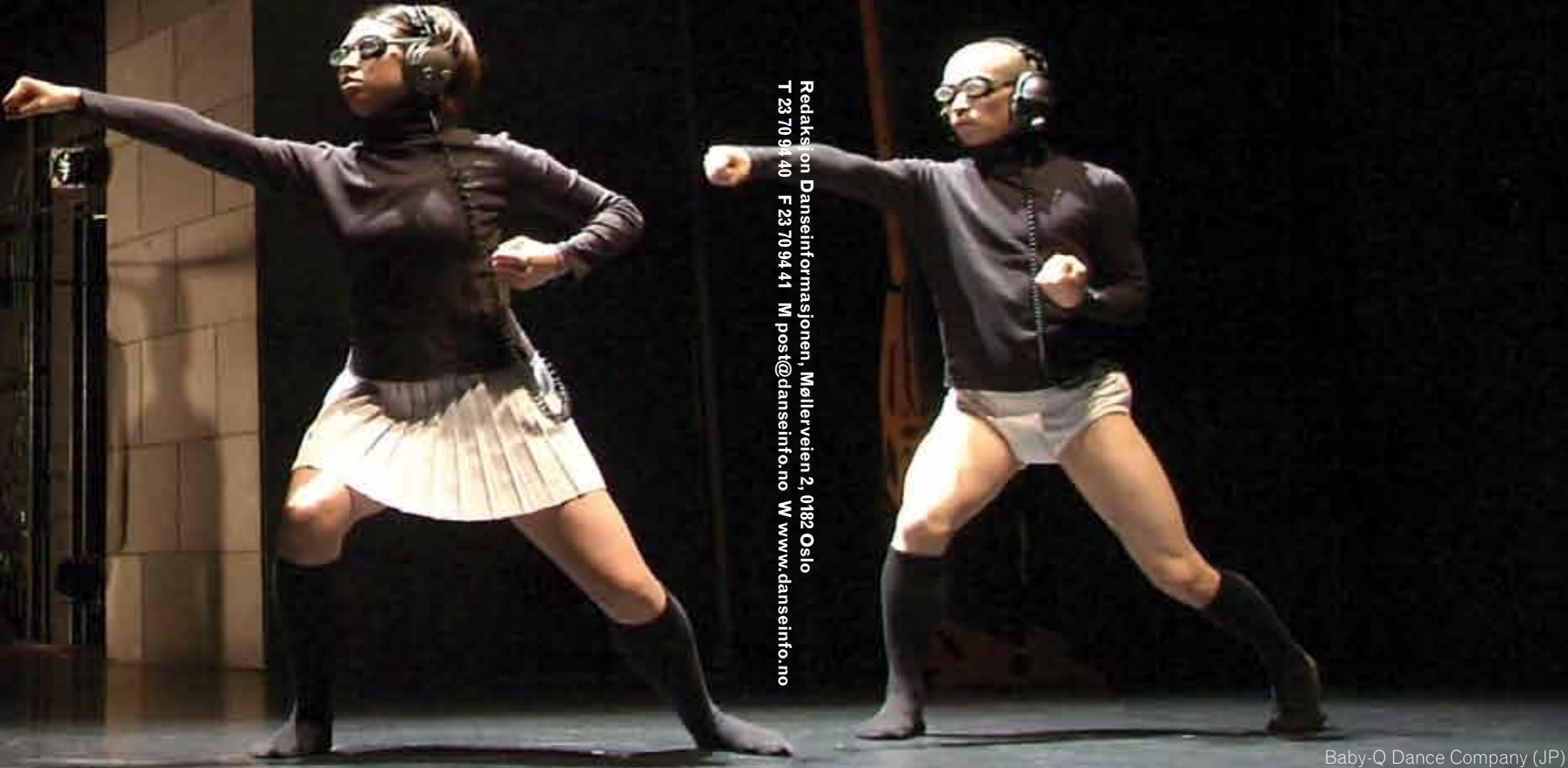
Redaksjon Danseinformasjonen, Mellerveien 2, 0188 Oslo T 23 70 94 40 F 23 70 94 41 E post@danseinfo.no W www.danseinfo.no