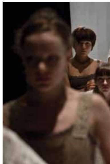
NEW SHE KNOWS