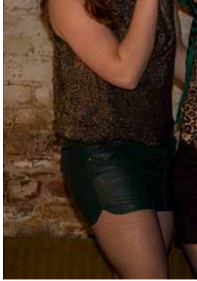
SØSTRENE FRA LINDENAU

Weg/Francesco Scavetta LIVE! BIPOD-Beirut International Platform of Dance, Babal Theatre, Beirut, Libanon 21. april Konsept, koreografi, scenografi og dans Francesco Scavetta Musikk Luigi Ceccarelli Live electronics Antonino Chiamarante Musiker Paolo Ravaglia